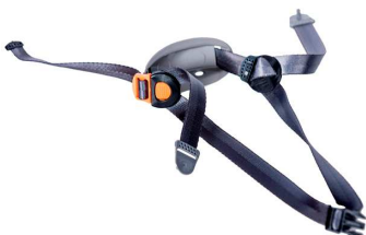
Jugulaire nylon 4 points de rechange REF HPVGJUG521