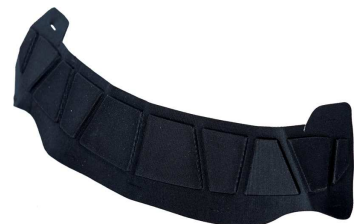
Bandeau anti-sueur de rechange REF HPVGBAND521