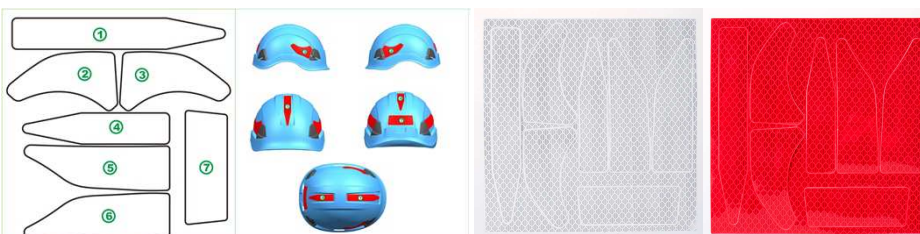
Planche de 7 autocollants réfléchissants haute qualité avec motif en nid d'abeilles pour une meilleure visibilité.